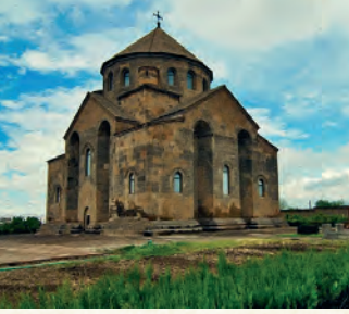
Սուրբ Հռիփսիմե տաճար

իր կինը, սակայն մերժում է ստանում: Այդժամ նա հրամայում է բերել նաև Գայանեին, որպեսզի նա համոզի Հռիփսիմեին հնազանդվել իրեն: Սակայն Գայանեն, ընդհակառակը, հորդորում և քաջալերում է իր սանին՝ Հռիփսիմեին, անխախտ պահել Աստծու առաջ արված ուխտը: Այս ամենը տեղի է ունենում Տրդատ արքայի և պալատականների ներկայությամբ: Նրանք, ովքեր հասկանում էին հռոմեացիների լեզուն, բացատրում են Տրդատին, որ Գայանեն արքայի ասածին հակառակ խորհուրդներ է տալիս Հռիփսիմեին: Տրդատը բարկանալով ցանկանում է բռնությամբ հնազանդեցնել Հռիփսիմեին, սակայն չի հաջողում, և դեռ ավելին, Հռիփսիմեին հաջողվում է հեռանալ պալատից: Այդ գիշերն իսկ Տրդատի ուղարկած դահիճները տանջամահ են անում Հռիփսիմեին և նրա 33 ընկերուհիներին, հաջորդ օրը նույն ճակատագրին են արժանանում նաև սուրբ Գայանեն և ևս երկու միանձնուհի աղջիկներ: