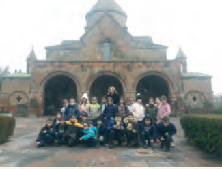
Սր. Գայանե եկեղեցի, ք. Վաղարշապատ: Գտնե՛ք եկեղեցի բառի բացատրությունը՝ օգտվելով nayiri.am կայքից: