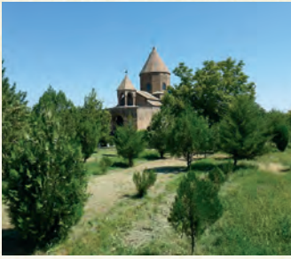
Վաղարշապատ քաղաքում է գտնվում Հռիփսիմյան ևս մեկ միանձնուհու՝ Մարիաների նվիրված Սբ. Շողակաթ եկեղեցին: Փորձիր պարզել, թե ինչու է եկեղեցին կոչվել Շողակաթ, ինչպես նաև տվյալներ Մարիանե միանձնուհու մասին:

կարող է բժշկել միայն Արտաշատում գետնափոր խուցը նետված Գրիգորը: Երբ Խոսրովիդուխտը այս մասին պատմում է պալատականներին, շատերը նրան ծաղրում են՝ ասելով, թե ինչպես կարող է նա մտածել, որ Գրիգորը, ով ավելի քան 13 տարի է նետված է օձերով ու կարիճերով լեցուն խուցը, դեռ ողջ է: Սակայն ըստ ավանդության շուտով հրեշտակը կրկին հայտնվում է Խոսրովիդուխտին՝ ասելով նույն բանը, նույնիսկ հորդորելով ու սպառնալով նրան անպայման ազատել տալ Գրիգորին: Այս մասին կրկին պալատականներին և իշխաններին պատմելուց հետո արդեն որոշվում է մարդիկ ուղարկել Արտաշատ Գրիգորի ետևից: Գալով Արտաշատ՝ նրանք իրոք գտնում են Գրիգորին կենդանի և առողջ վիճակում իր խցում՝ Խոր Վիրապում: Անմիջապես նրան հասցնում են Վաղարշապատ՝ պատմելով պատահածի մասին: Երբ Գրիգորը՝ շրջապատված ժողովրդի և իրեն ուղեկցող պալատականների ու զինվորների խմբով մոտենում է մայրաքաղաք Վաղարշապատին իշխանները և Տրդատ թագավորը ընդառաջ են գնում նրան: Գրիգորը բժշկում է արքային, իշխաններին ու պալատականներին, որից հետո՝ տեղեկանալով Հռիփսիմյան կույսերի նահատակության վայրերի մասին, շրջում և գտնում է նրանց մասունքները, իսկ միանձնուհիների նահատակությունների վայրերում սկսում քրիստոնեական սրբատեղիների կառուցապատումը, որոնք հետագայում վեր են ածվում եկեղեցիների: